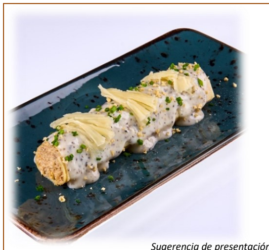
Sugerencia de presentación

FICHA TÉCNICA: GRANDCANELÓN SUPREMO DE POLLO DE CORRAL CON FOIE Y TRUFA 140g