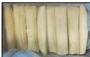
Bolsa (1 capa de 8 canelones)