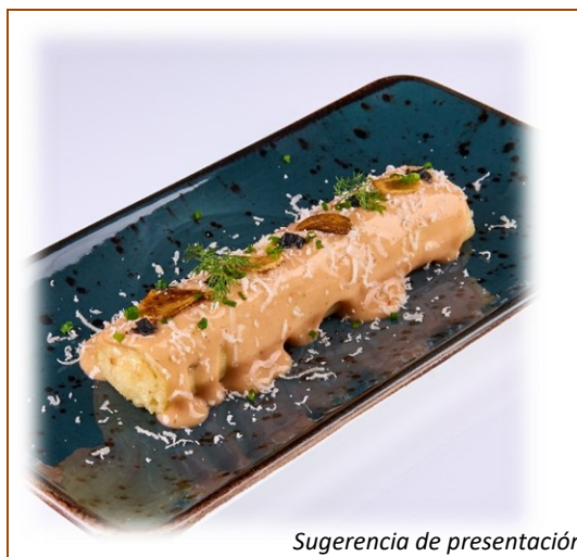
Sugerencia de presentación

FICHA TÉCNICA: GRANDCANELÓN SUPREMO DE BRANDADA DE BACALAO CON AJO ESCALIVADO 140g