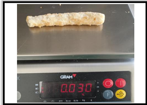
PESO: 20-30 g